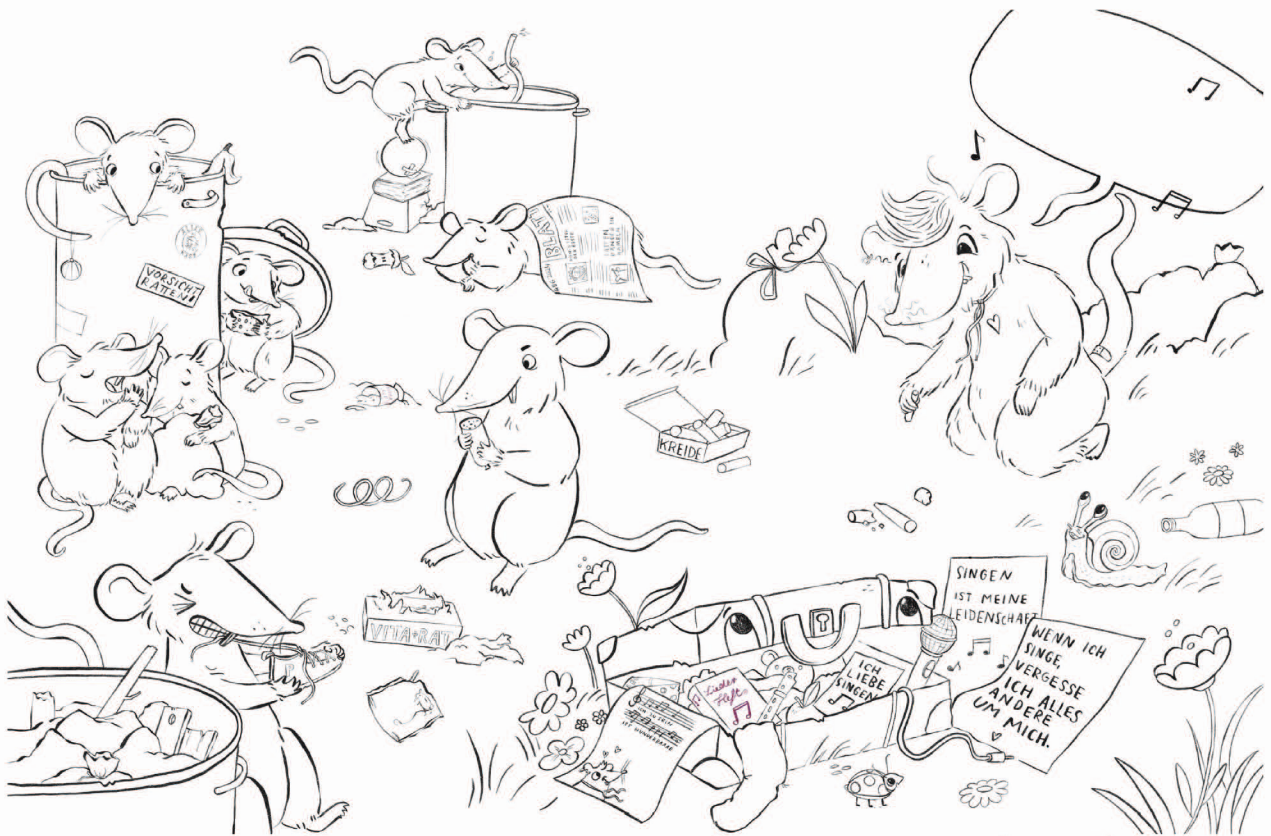
Illustration: Julia Francke

Wenn du für einen Tag lang eine Ratte wärst, was würdest du alles tun? Male auf.